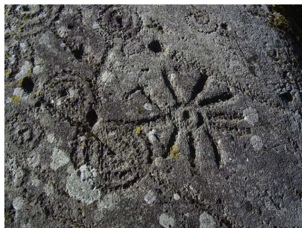
fotografie di alcune incisioni rupestri visibili a Carschenna